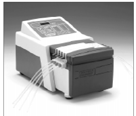
Afgebeeld: 205S/CA met 4-kanaals pompkop